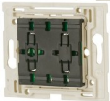
RF Tlačítko 4-bodové - NIKO, baterie 3V