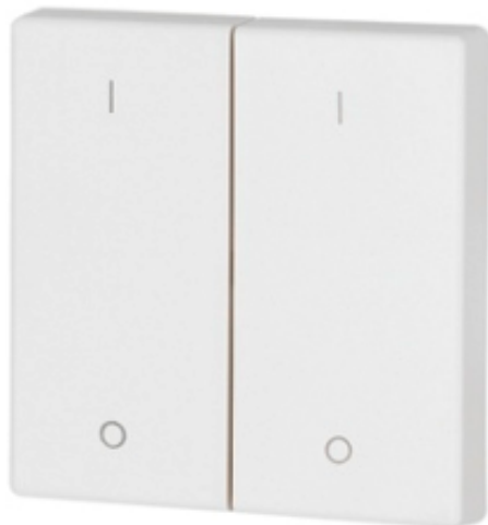
Kryt RF tlačítka NIKO, 45x45mm, 2x1/2 U-D-WHITE